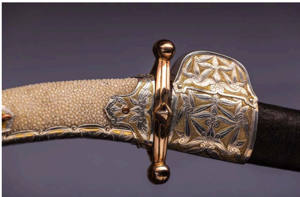
A karosi kard rekonstrukciójához hasonlóan szép lesz a geszterédi aranyszablya másolata is